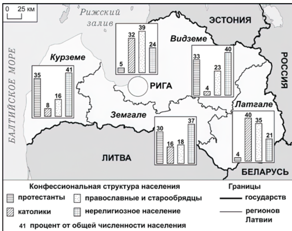
Рис. 3. Доля протестантов, католиков и православных со старообрядцами и нерелигиозного населения по историческим регионам Латвии (оценка на 2023 г.)

Fig. 3. The share of Protestants, Catholics, Orthodox with Old Believers and non-religious population by historical regions of Latvia (estimated for 2023)