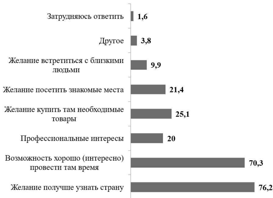
Рис. 2. Основные причины выбора стран для посещения, 2023 г. (в %)

Каковы же основные причины выбора тех или иных стран для посещения у представителей таганрогского студенчества? Как следует из полученных данных, основная мотивация молодых людей связана в большей степени с личным интересом, не имеющим прагматического обоснования (рис. 2).