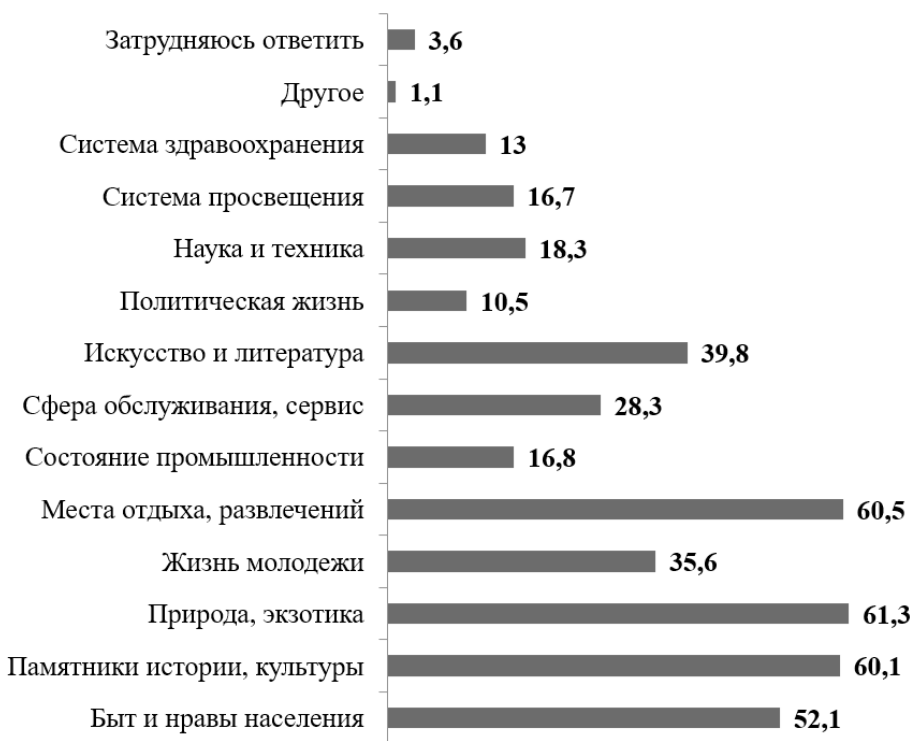
Рис. 3. Основные стороны жизни зарубежных стран, интересующие студентов, 2023 г. (в %)

Помимо этого, респондентам был задан вопрос об интересующих их сторонах жизни и быта в зарубежных государствах. Стоит отметить, что ответы на этот вопрос во многом подтвердили данные, полученные при изучении мотивов посещения других стран (рис. 3).