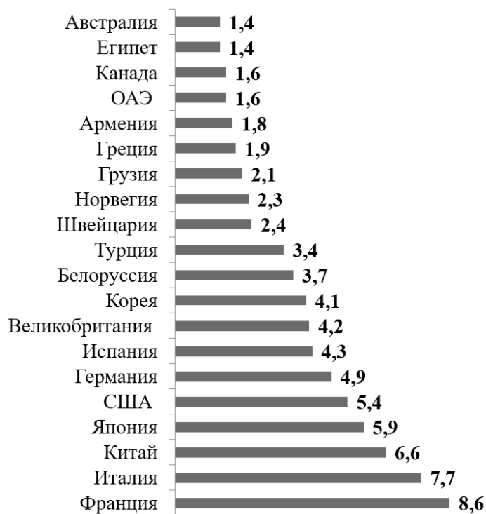
Рис. 1. Страны, которые хотели бы посетить студенты г. Таганрога, если бы у них была такая возможность, 2023 г. (в %)

соответственно (3,4 % и 1,4 %). По всей видимости, именно их популярность и является причиной подобного распределения – эти страны практически перестали ассоциироваться в сознании россиян с их культурой и историей, а стали восприниматься, скорее, как просто одно из возможных мест для отдыха, наиболее доступное за границей. Поэтому, как видно из полученных данных, обладая гипотетической возможностью поехать куда угодно – в любую точку мира, молодые люди, в своем большинстве, реализовали бы ее более оригинально. Также стоит заметить, что у представителей современного студенчества не вызвали особого интереса страны Южной Америки и Африки (помимо Египта). Так, среди стран Латинской Америки были указаны: Бразилия, Аргентина (34-е и 35-е места, по 0,6 % соответственно), Перу, Колумбия (58-е и 61-е места – по 0,2 % соответственно). Из африканских государств молодые люди указали Алжир (45-е место – 0,3 %), Центральноафриканскую Республику (55-е место – 0,2 %), Тунис (68-е место – 0,1 %), Нигерию (73-е место – 0,1 %). Отметим, также, что в список стран, в которые хотели бы поехать студенты, попала и Украина – 0,8 % (30-е место).