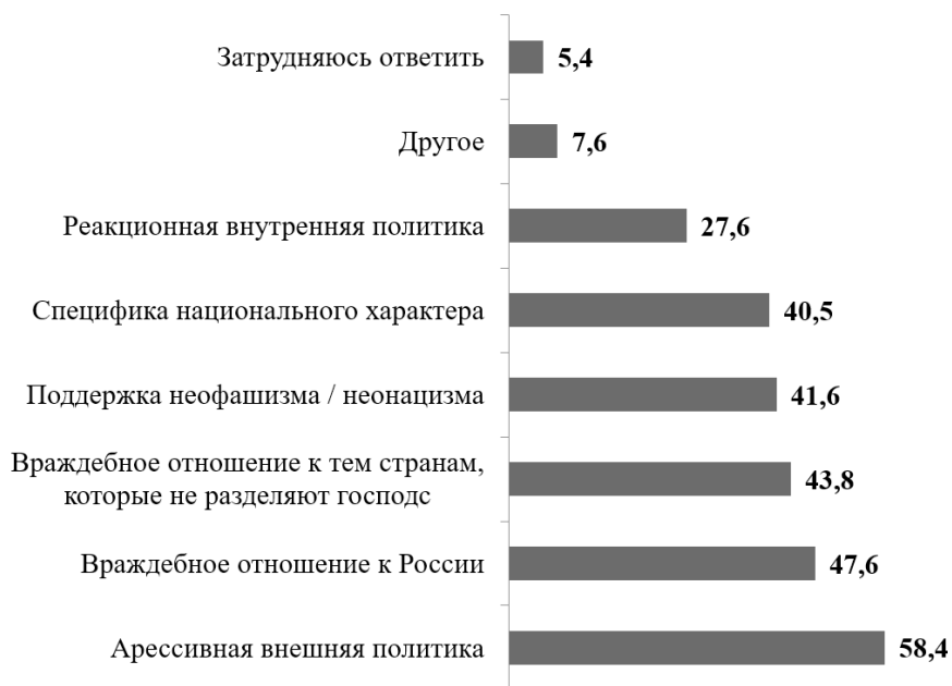
Рис. 2. Основные причины личной неприязни студентов к другим государствам, 2023 г. (в %)

Обращает на себя внимание тот факт, что среди стран, вызывающих у молодежи неприязнь, которые были отмечены чаще всего, присутствуют как государства, причисляемые к «врагам», так и к «друзьям». Это говорит о том, что при ответе на вопрос о «странах-врагах» и «странах-друзьях» студенты руководствовались, в первую очередь, не личными эмоциями, а именно оценкой их поведения в отношении России. Примером может служить Индия, названная одним из основных союзников, но при этом попавшая в список государств, вызывающих антипатию. Однако Индия названа одним из главных миротворцев. Интересная ситуация складывается в отношении Франции. Эта страна попала в число «недрузгов» России, а также вызывает личную неприязнь. Но в то же время Франция, по мнению студентов, прилагает усилия для сохранения мира. Получается, что представители студенчества верят в благие намерения французского руководства, однако недовольны их выбором стороны и политикой в отношении России, проводимой в соответствии с этим.