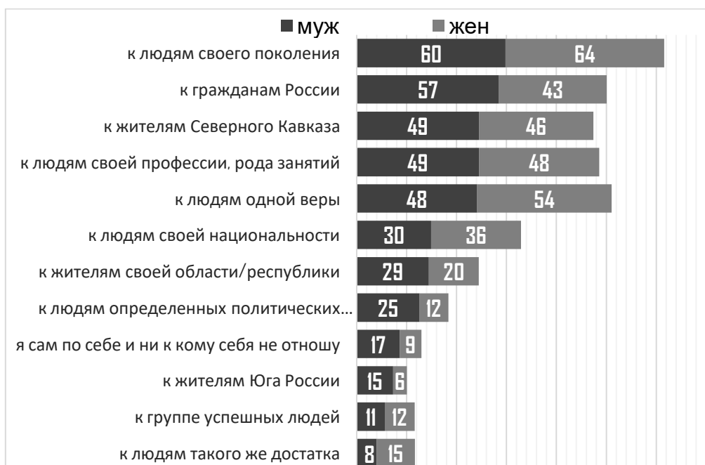
Рис. 3. Групповая идентичность населения Республики Дагестан