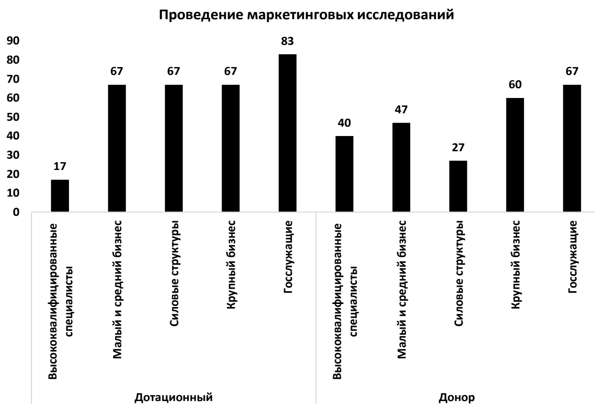
Рис. 3. Социальные практики в структурах и организациях в сфере общественного мнения (высокая степень использования), %

На втором месте по частоте обращаемости к данным практикам в дотационных регионах 3 категории объектов: крупный бизнес, силовые структуры, малый и средний бизнес (которые в равной степени по 67 % активно используют эти практики), но в регионах экономически независимых такого сплочения при использовании этой социальной практики нет. В этой группе регионов (как отмечалось выше) использует маркетинговые исследования как практику при защите социальных интересов преимущественно крупный бизнес (60 %). Несколько реже малый и средний бизнес – 47 %, еще реже представители силовых структур – 27 %. Особое отношение к применению маркетинговых исследований как социальной практики в защите социальных интересов отмечается среди высококвалифицированных специалистов. В экономически независимых регионах к этому виду социальной практики прибегают и часто до 40 % высококвалифицированных специалистов.