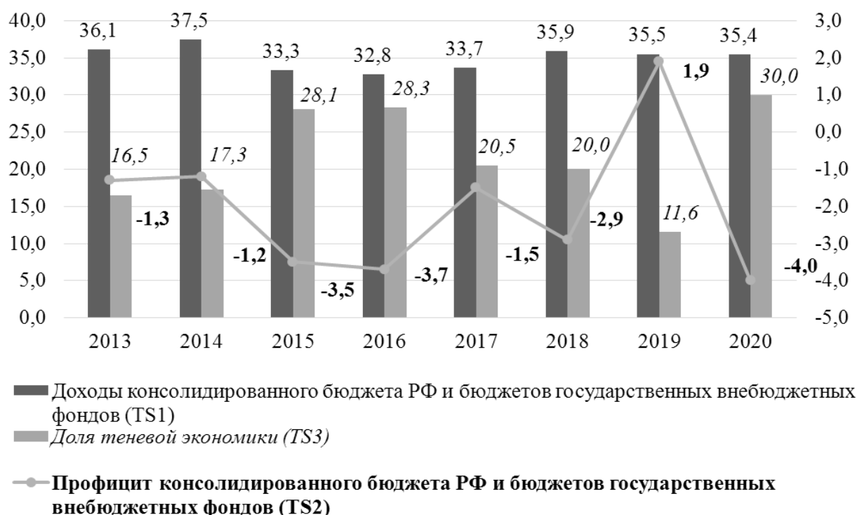
Рис. 1. Динамика показателей налоговой безопасности России в 2013–2020 гг., % ВВП 1

Также сформирована система показателей для измерения налоговой безопасности в России – динамика значений этих показателей в 2013–2020 гг. приведена на рис. 1.