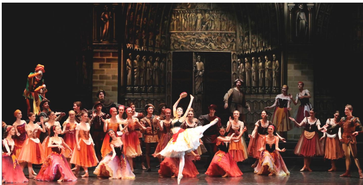
Балет «Эсмеральда» на Исторической сцене Большого театра России, 2019 г.