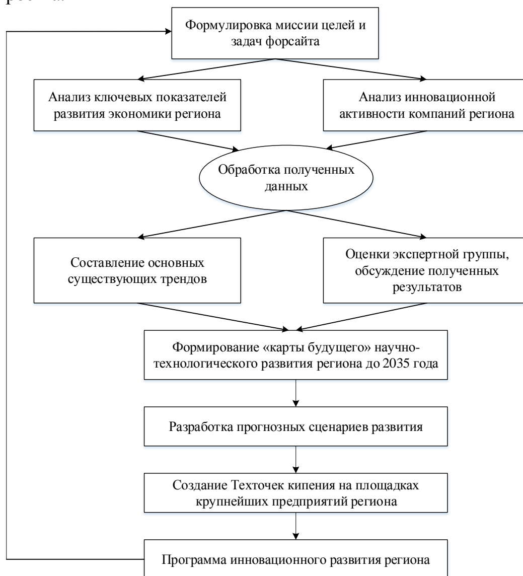
Схема проведения технологического форсайта на региональном уровне

Ростовской области считаем возможным создание своего рода алгоритма (рисунок), позволяющего поэтапно оценить результативность внедряемого проекта.