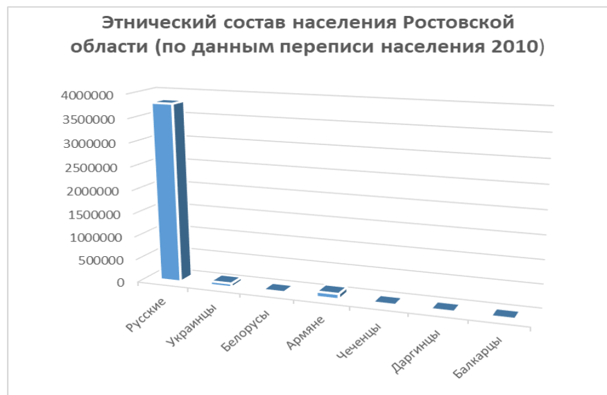
Рис. 1. Этнический состав населения Ростовской области (по данным переписи населения 2010 г.)

для регионов с разной этнокультурной структурой, к которым относится и Ростовская область (рис. 1) (Всероссийская перепись населения, 2010).