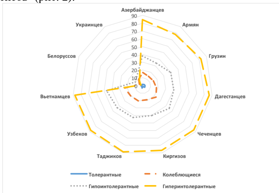
Рис. 2. Негативное отношение к соседству с семьей представителей этнических меньшинств респондентов, различающихся установками толерантности / интолерантности, % опрошенных

Однако разные группы респондентов существенно различаются своим отношением к представителям той или иной национальности. Негативное отношение интолерантных респондентов к соседству с семьей другой национальности на порядок выше, чем среди толерантных респондентов 1 (рис. 2).