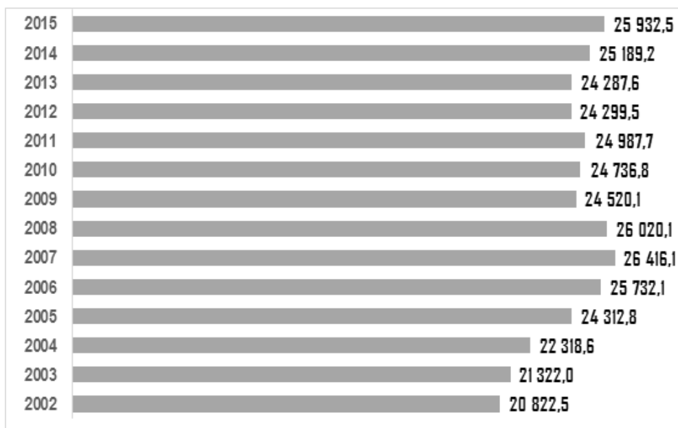
Рис. 1. Численность занятых по временным контрактам в странах ЕС-28, тыс. чел. [21]

Рассмотрим масштабы и динамику прекариатизации социально-трудовых отношений на материалах западноевропейских статистических наблюдений. По данным Евростата, с 2002 по 2015 г. численность временно работающих (трудовые контракты длительностью не более чем 12 месяцев) в 28 странах ЕС увеличилась практически на 5 млн – с 20,8 до 25,9 млн чел. (рис. 1). В 2015 г. эта категория работников составляла 14 % от общего числа экономически активного населения.