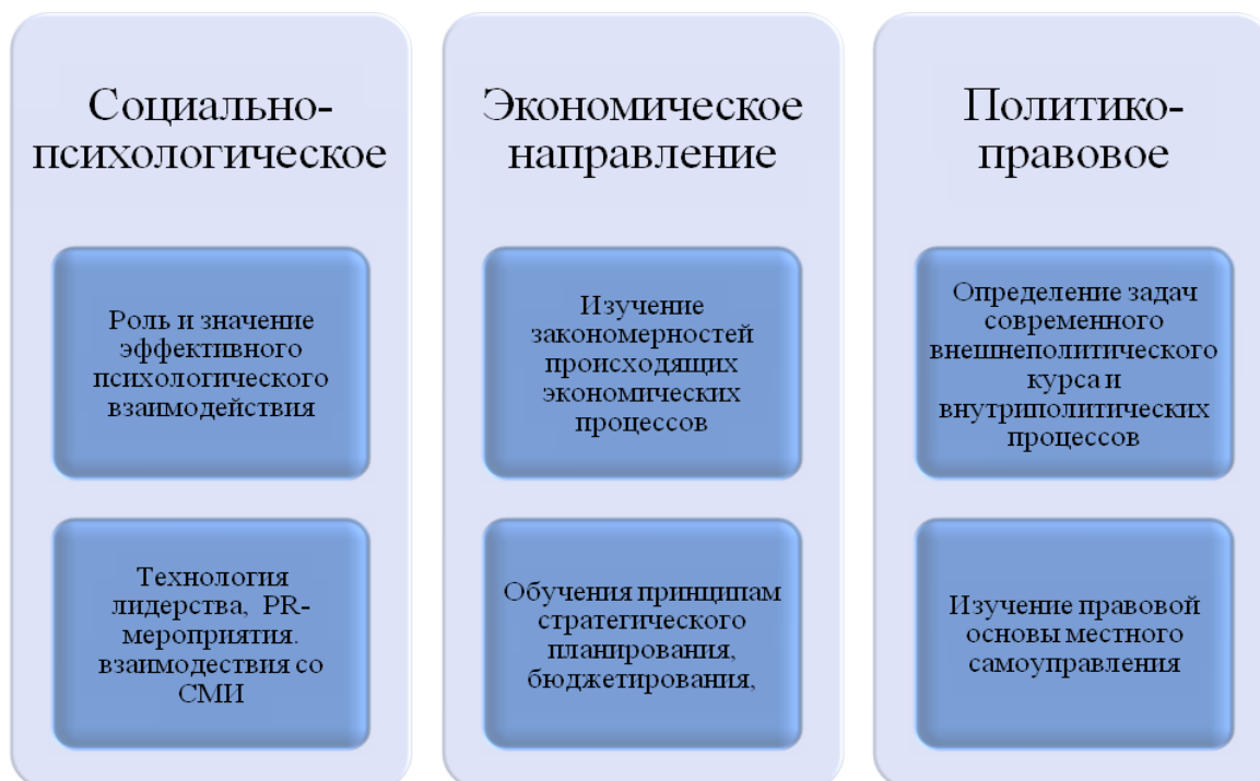
Рис. 3. Структура ПСЭР 1

Рассматривая второй блок ПСЭР, важно отметить, что методическое построение курса подготовки руководителей также должно включать стандартные и инклюзивные направления (рис. 3).