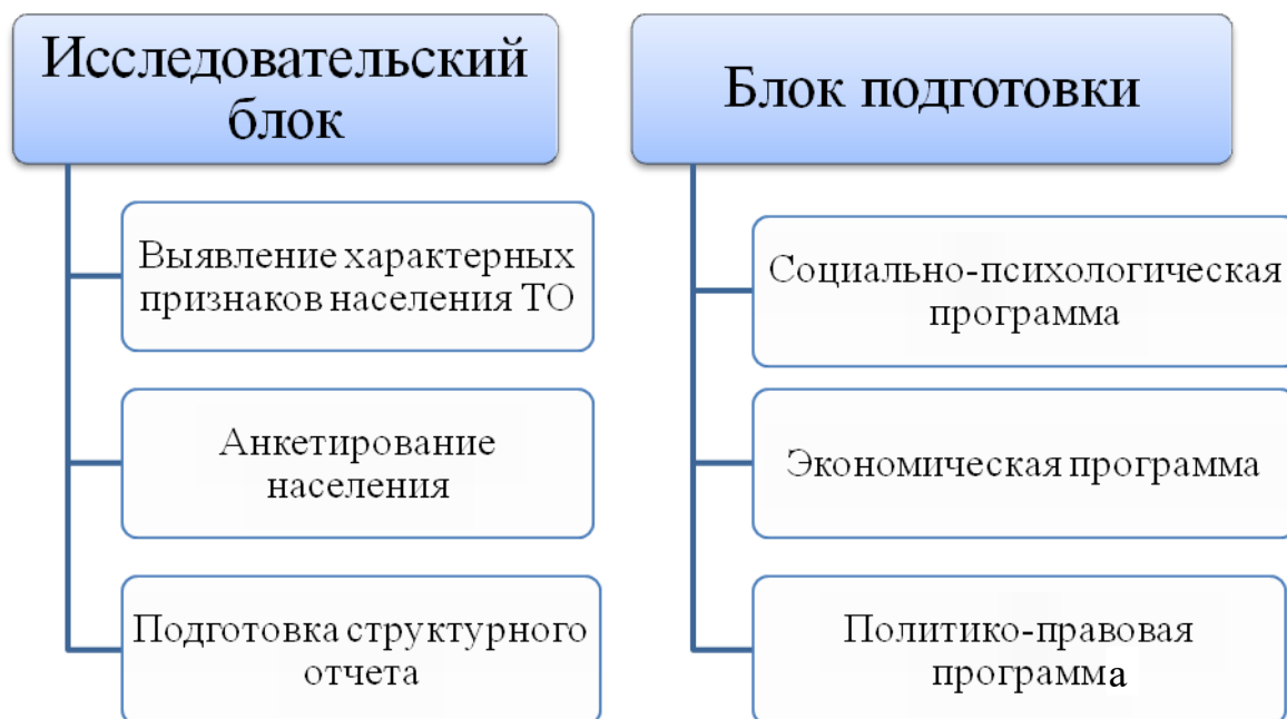
Рис. 1. Методика повышения эффективности взаимодействия местного населения и политической элиты

Методика повышения эффективности взаимодействия местного населения и политической элиты может быть разбита на два структурных блока (рис. 1).