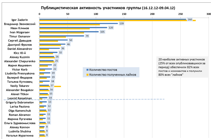
Рис. 1. Статистика публицистической активности участников дискуссии (N=244)

пользователя, хотя бы однажды опубликовавшего комментарий или пост. На рисунке 1 представлена статистика наибольшей публичностной активности участников группы.